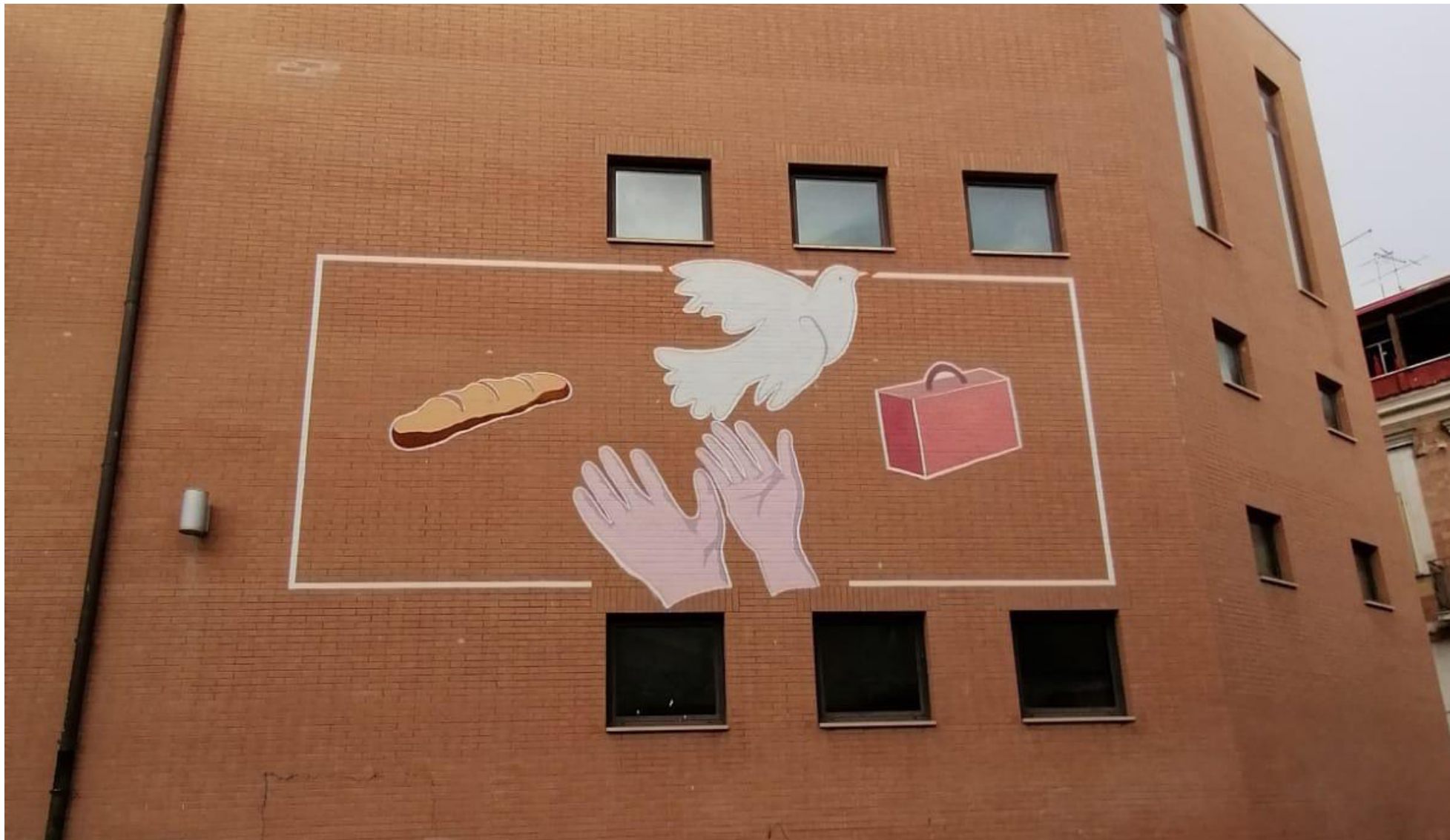
Foggia Accademia delle Belle Arti di Foggia