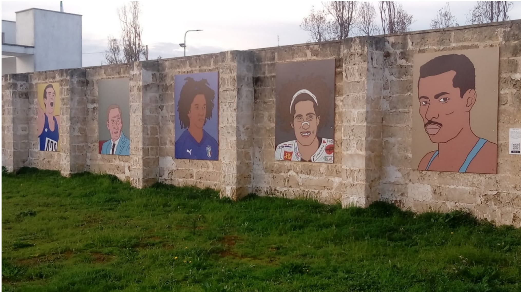
Racale associazione culturale Walls of World