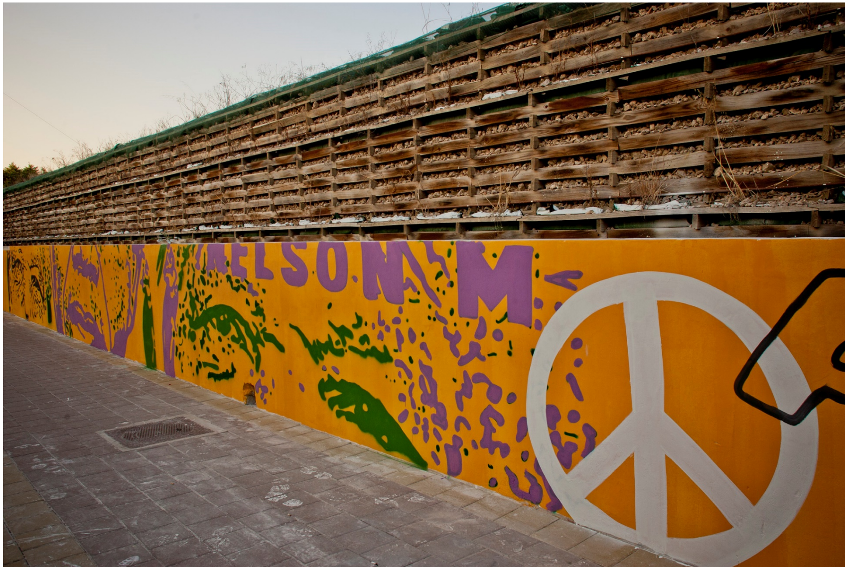
Galatone associazione 167B Street, direzione artistica di Chekos'art