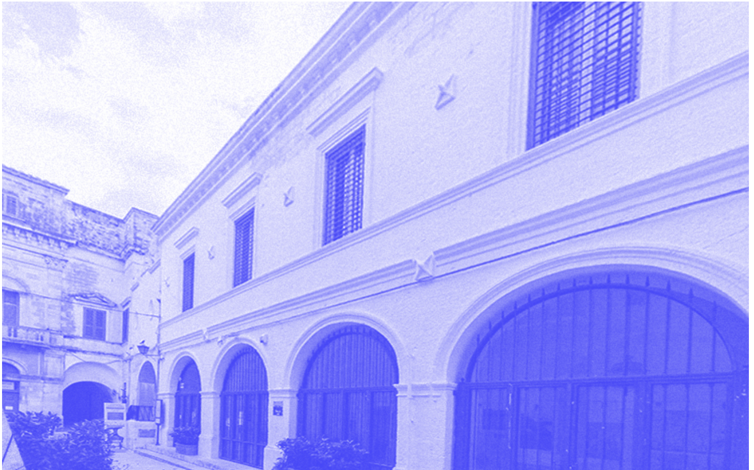
Palazzo San Giuseppe, la prima sede del Museo

Un anno dopo, nel 1998, con una grande mostra dedicata al celebre artista, fu inaugurato il Palazzo Pino Pascali, Museo comunale d'arte contemporanea , ospitato nello storico Palazzo San Giuseppe, nel centro storico polignanese.