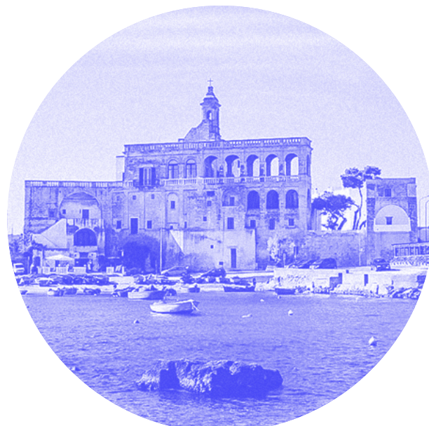
Abbazia di San Vito