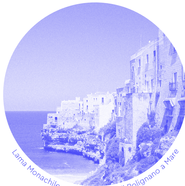
Lama Monachile, centro storico di Polignano a Mare

Nelle estati dal 1992 al 1997 si svolgeva la rassegna artistica Ritorno al mare , a cui presero parte circa cento artiste e artisti internazionali ospitati «un po' a Polignano e un po' nella vicina abbazia di San Vito per il periodo necessario a realizzare le loro opere: performance teatrali, video, musiche, danze, pitture, sculture, installazioni che nascevano ovunque: dal mare, tra gli scogli, sulla spiaggia, nelle barche di legno, nelle bianche cassette dei pescatori o fuori, sulle loro terrazze.»*